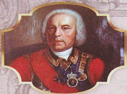
Георг Вильгельм де Геннин