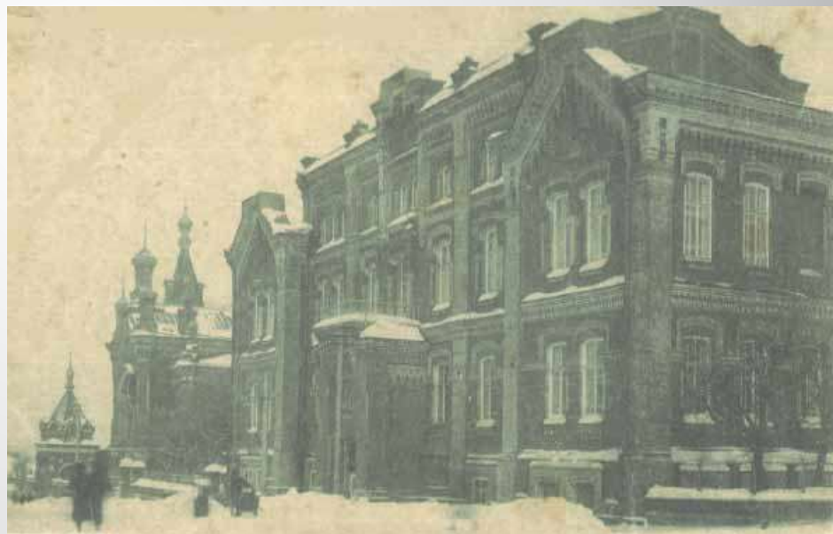
Пермская духовная семинария

В 1866г. был определён в Екатеринбургское духовное училище. Затем 4 года отучился в Пермской духовной семинарии. Потом будущий писатель учился на ветеринара в Петербургской медико-хирургической академии, затем на юридическом факультете Петербургского университета. Но, проучившись год, вынужден быть оставить из-за материальных трудностей и резкого ухудшения здоровья (начался туберкулез).