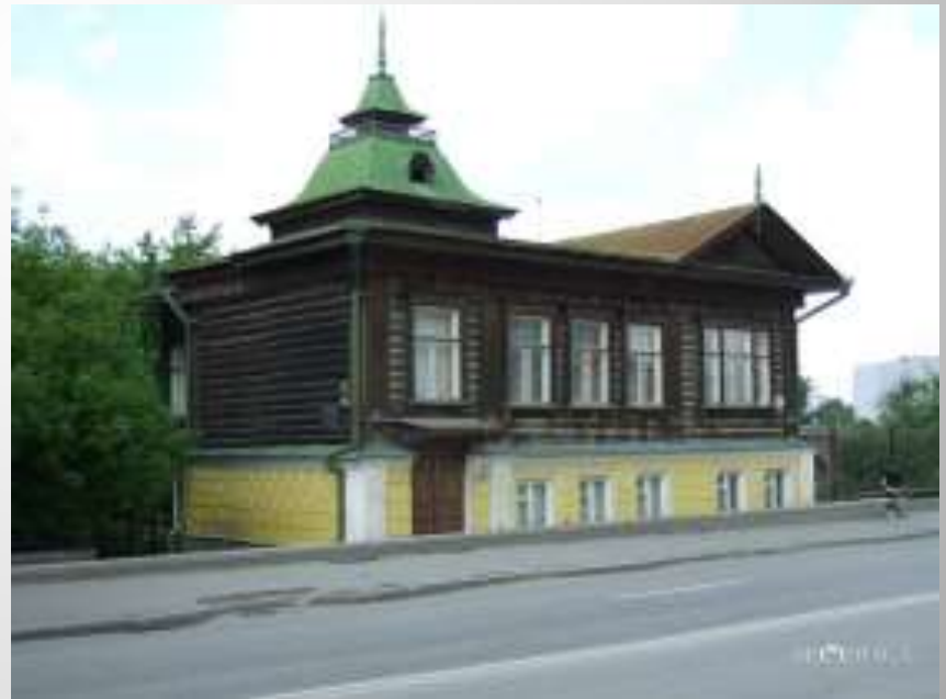
Дом, в котором жил писатель в Екатеринбурге

Летом 1877 вернулся на Урал, к родителям. В следующем году умер отец, и вся тяжесть забот о семье легла на Мамина-Сибиряка. Чтобы дать образование братьям и сестре и суметь заработать, решено было переехать в крупный культурный центр. Был выбран Екатеринбург, где начинается его новая жизнь.