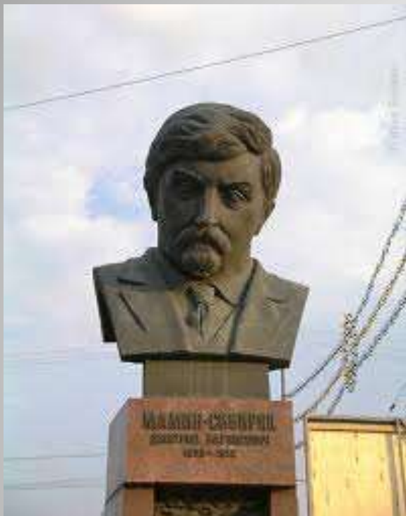
Памятник Д.Н.Мамину- Сибиряку в Екатеринбурге.