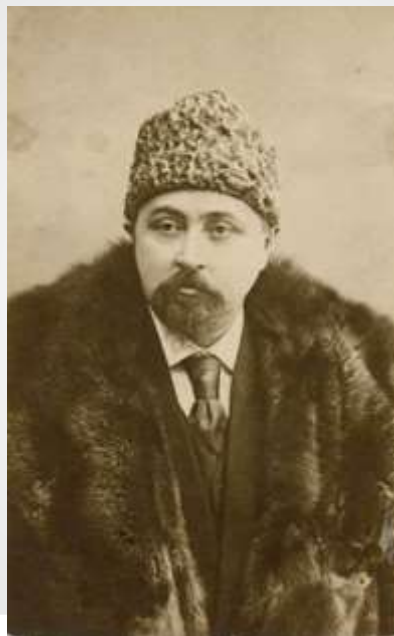
Дмитрий Наркисович Мамин-Сибиряк 1852 - 1912