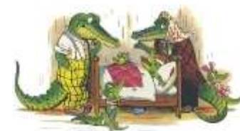
Тотошенька, Коккошенька, Лелёшенька