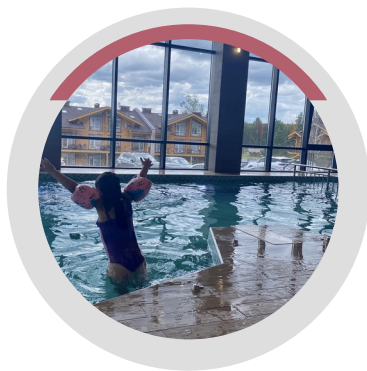
ПЛАВАЛА В БАССЕЙНЕ