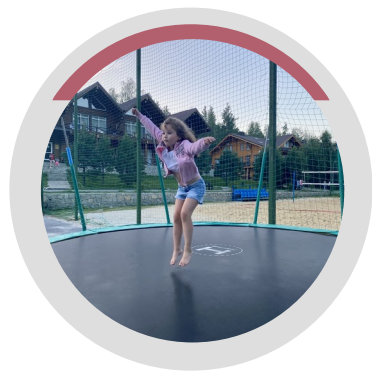
ПРЫГАЛА НА БАТУТЕ