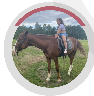
КАТАЛАСЬ НА ЛОШАДИ