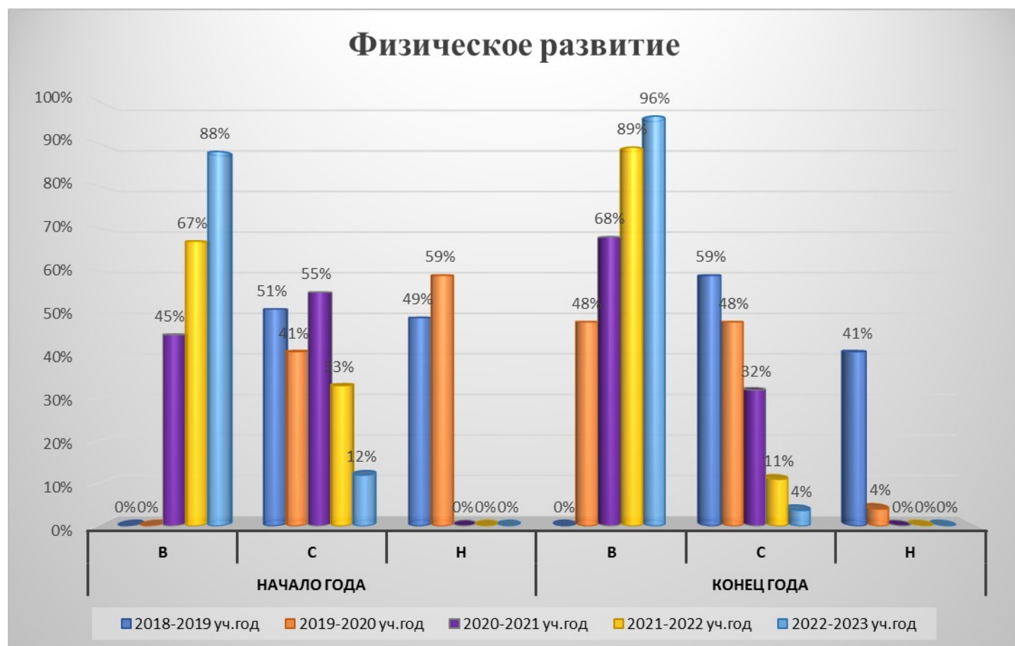
Рисунок 4 .Мониторинг уровня усвоения образовательной программы в области физического развития