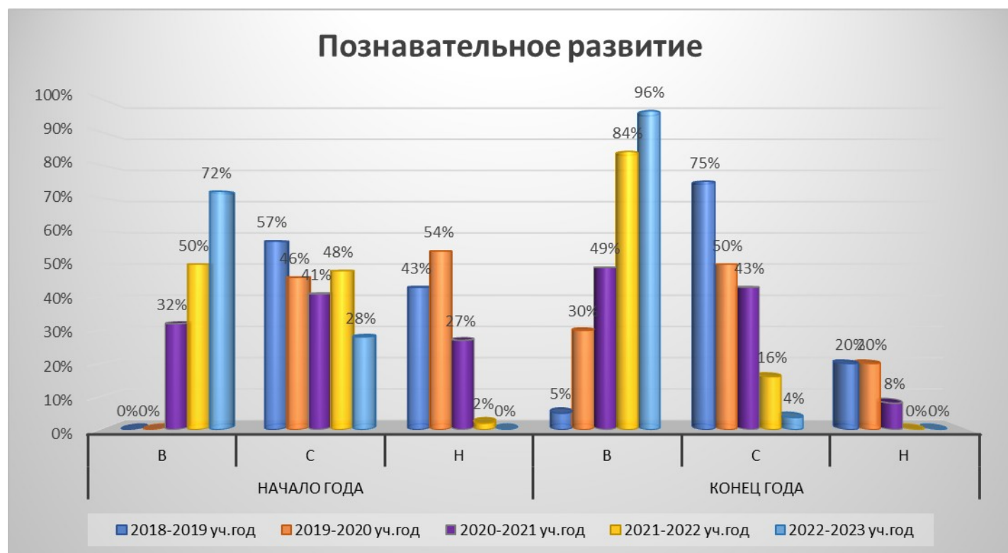
Рисунок 1. Мониторинг уровня усвоения образовательной программы в области познавательного развития