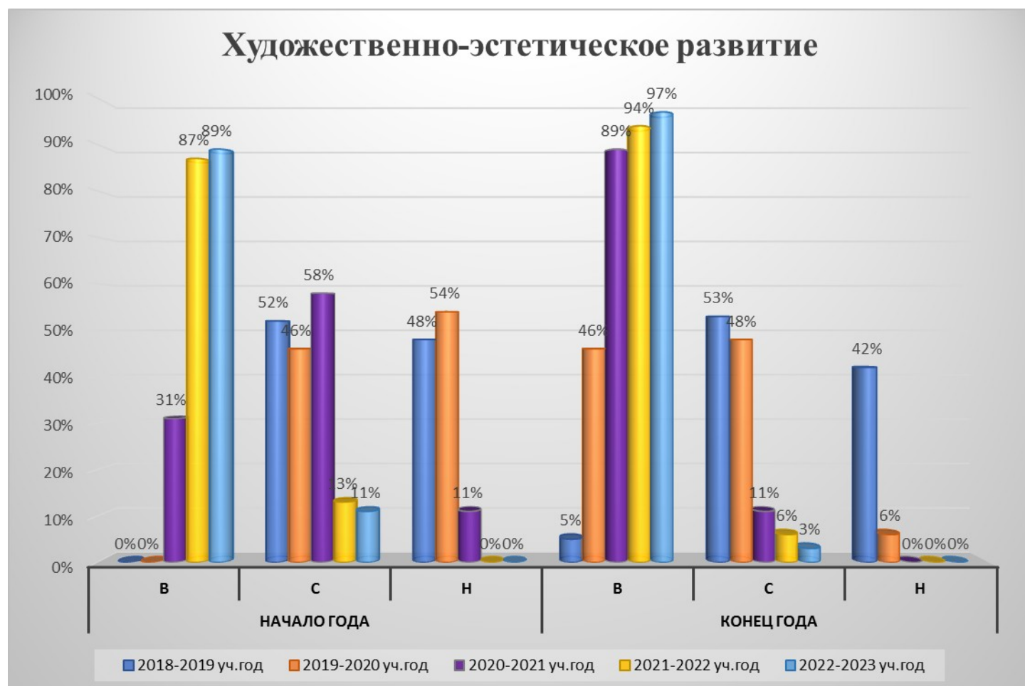
Рисунок 3. Мониторинг уровня усвоения образовательной программы в области художественно-эстетического развития